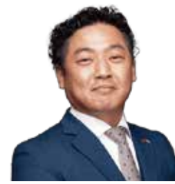
同心協力委員会 副会長