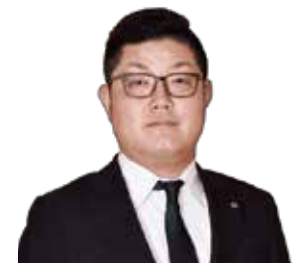
同心協力委員会 委員長