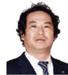
総務広報委員会 委員長